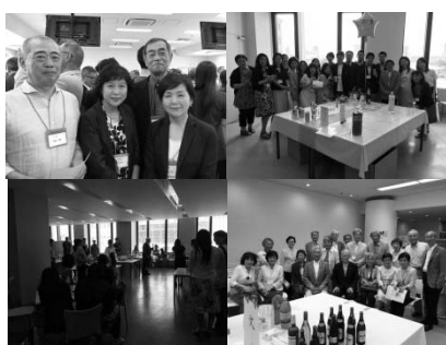
(右より金祝・ルビー祝・銀祝・銅祝のみなさん)

年々参加者が増え盛り上がり を見せているASFですが、二 〇一四に始まったばかりの「ル ビー祝（卒業四〇周年）」はまだ 馴染がないのか参加者が少ない 様です。来年該当年の一九七七 年卒のみなさま、ぜひお忘れな くご参加ください。